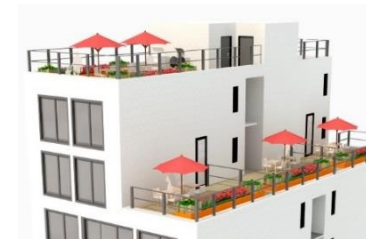
여유로운 일상의 루프탑아지트