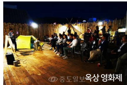
중도일보 옥상 영화제