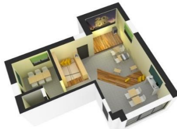
함께 만들어가는 커뮤니티 공간